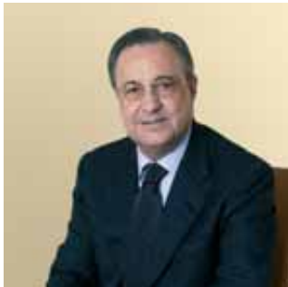
D. Florentino Pérez Rodríguez Presidente y Consejero Delegado

Nacido en 1947. Ingeniero de Caminos, Canales y Puertos.